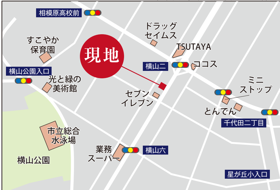
現地案内図 カーナビ 相模原市中央区横山3-31付近