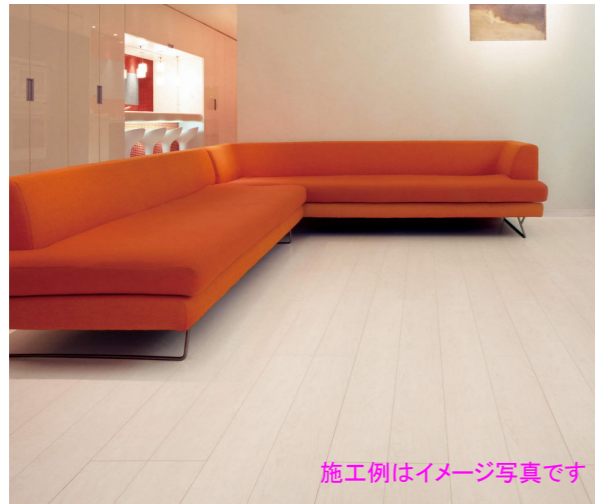
施工例はイメージ写真です