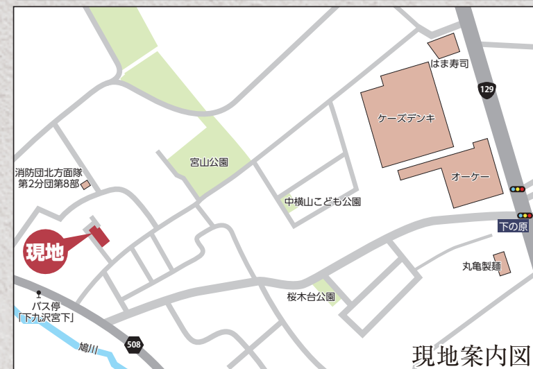
現地案内図 カーナビ 相模原市緑区下九沢583付近

【フラット35】S 金利B プラン利用可 優良住宅取得支援制度 【別途費用】 フラット 35 適合証明取得費用 (利用の場合) 外構、火災保険、住宅ローンに伴う費用