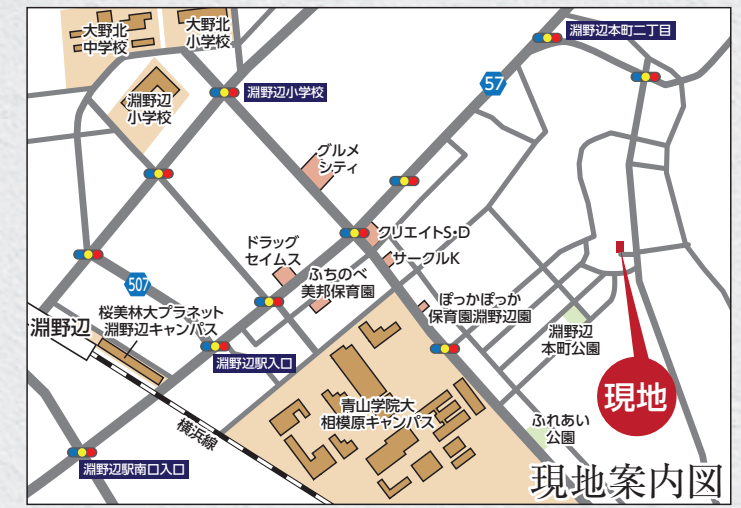
カーナビ 相模原市中央区淵野辺本町3丁目40付近