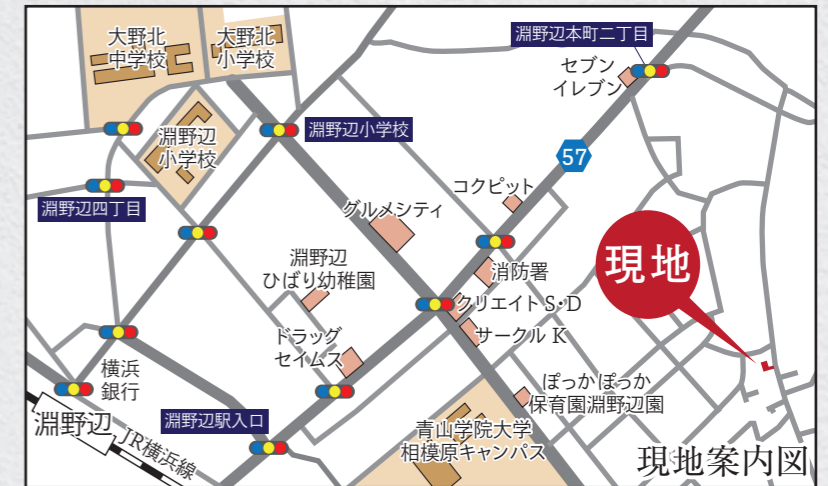
カーナビ 相模原市中央区淵野辺本町4丁目743-2と入力