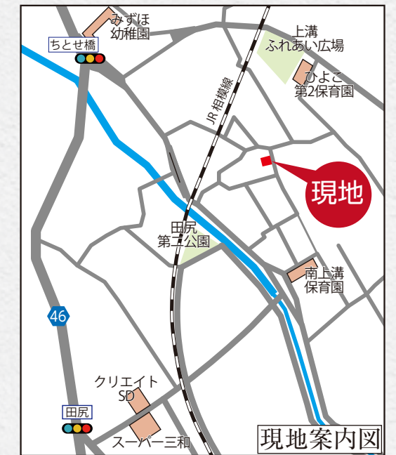
カーナビ 相模原市中央区上溝1909付近