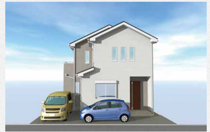
※イメージパースにつき実際とは異なる場合がございます。