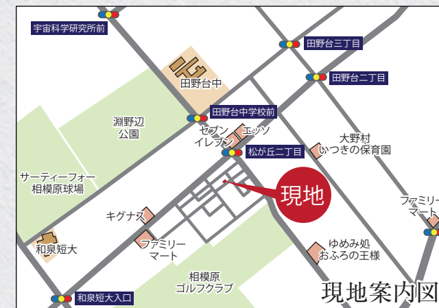
カーナビ 相模原市中央区松が丘2丁目3-3と入力