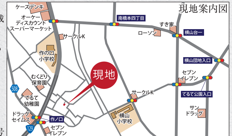
カーナビ 相模原市緑区下九沢319付近