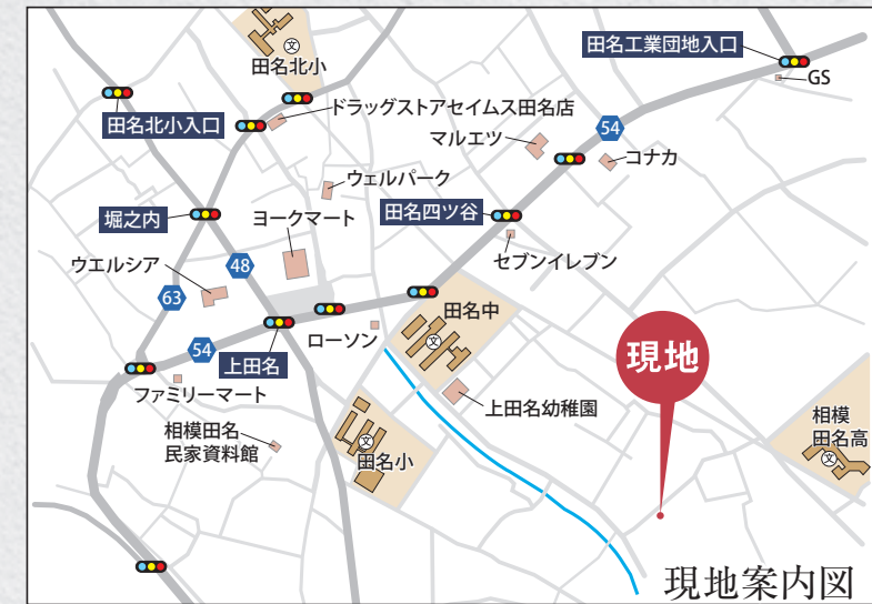
カーナビ 相模原市中央区田名6691付近

【フラット35】S 金利Bプラン利用可 優良住宅取得支援制度 【別途費用】 フラット35 適合証明取得費用(利用の場合) 外構、火災保険、住宅ローンに伴う費用