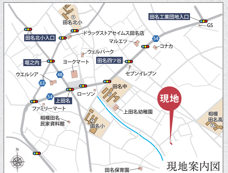
カーナビ 相模原市中央区田名6691付近