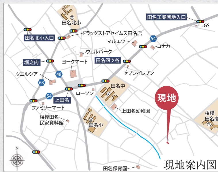
現地案内図 カーナビ 相模原市中央区田名6691付近

【フラット35】S 金利B プラン利用可 優良住宅取得支援制度 【別途費用】 フラット 35 適合証明取得費用 (利用の場合) 外構、火災保険、住宅ローンに伴う費用