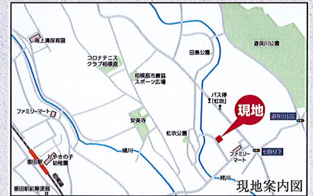
カーナビ 相模原市中央区上溝1253付近