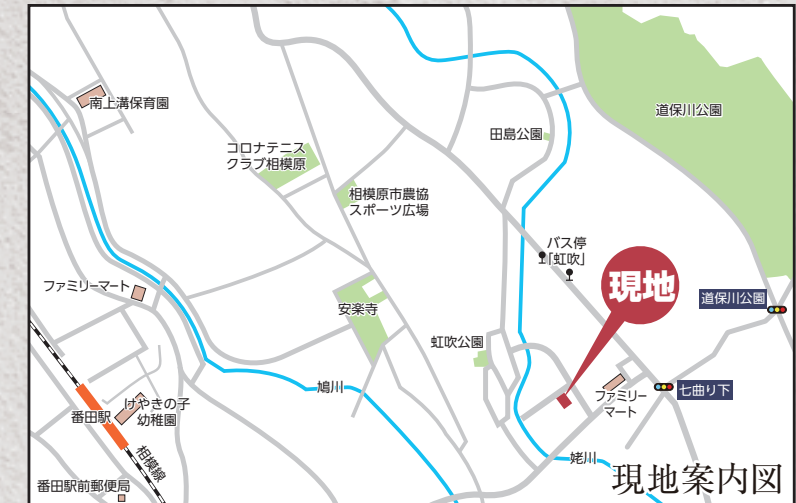
カーナビ 相模原市中央区上溝1252付近

【フラット35】S 金利B プラン利用可 優良住宅取得支援制度 【別途費用】 フラット35 適合証明取得費用(利用の場合) 火災保険、住宅ローンに伴う費用