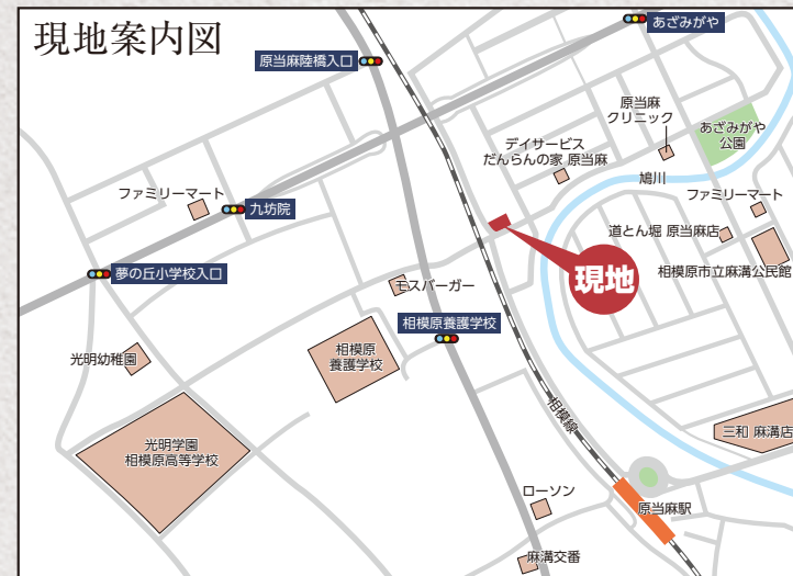
カーナビ 相模原市南区当麻1108-28付近

■所在地/相模原市南区当麻字薊ヶ谷1108-28,1108-29 ■交通/JR相模線「原当麻」駅より徒歩5分 ■土地/110.20㎡(33.33坪)~110.80㎡(33.51坪) ■用途地域/第2種中高層住居専用地域 ■地目/宅地 ■現況/更地 ■建ぺい率/60% ■容積率/200% ■都市計画/市街化区域 ■土地権利/所有権 ■土地価格/1,980万円~2,180万円 ■設備/公営水道、公共下水、東京電力、都市ガス