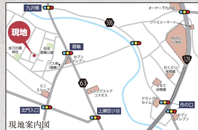
カーナビ 相模原市中央区田名字葛輪2759付近

【フラット35】金利Bプラン利用可 優良住宅取得支援制度 【別途費用】 フラット35適合証明取得費用(利用の場合) 火災保険、住宅ローンに伴う費用