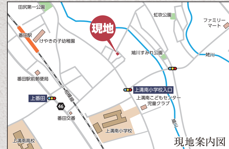
カーナビ 相模原市中央区上溝495付近

【フラット35】S 金利B プラン利用可 優良住宅取得支援制度 【別途費用】 フラット 35 適合証明取得費用 (利用の場合) 火災保険、住宅ローンに伴う費用