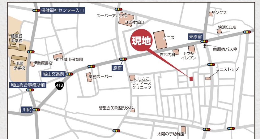
カーナビ 相模原市緑区原宿南2丁目11-13付近

【フラット35】S 金利B プラン利用可 優良住宅取得支援制度 【別途費用】 フラット35 適合証明取得費用 (利用の場合) 外構、火災保険、住宅ローンに伴う費用