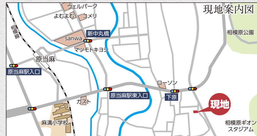
カーナビ 相模原市南区下溝1993付近