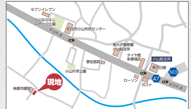
カーナビ 相模原市中央区宮下本町2丁目19-32付近