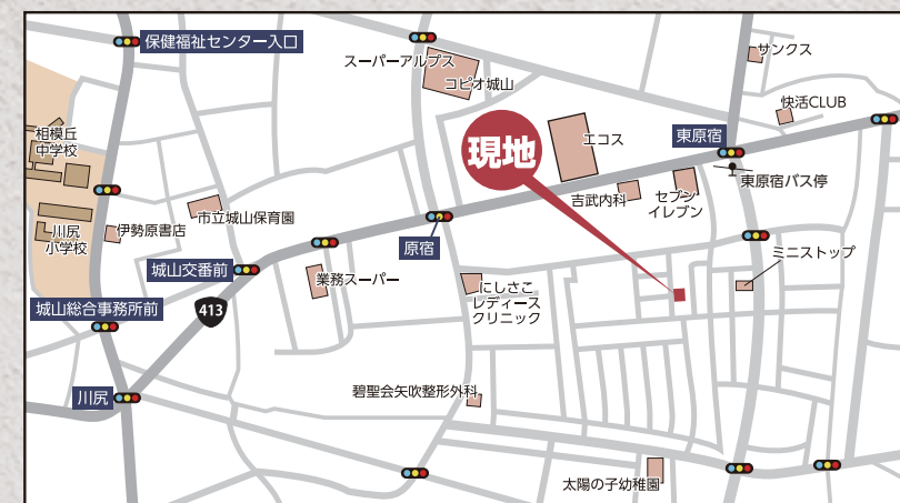
カーナビ 相模原市緑区原宿南2丁目11-18付近

【フラット35】S 金利B プラン利用可 優良住宅取得支援制度 【別途費用】 フラット 35 適合証明取得費用 (利用の場合) 外構、火災保険、住宅ローンに伴う費用