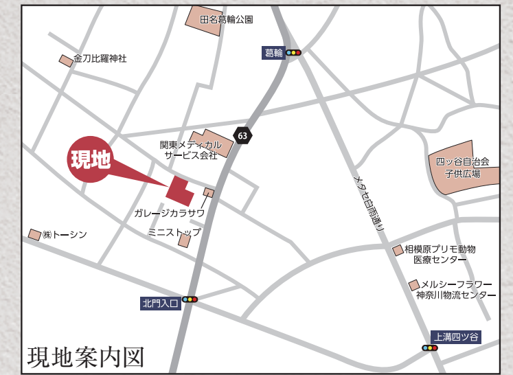
現地案内図 カーナビ 相模原市中央区田名2843-1付近

【フラット35】S 金利B プラン利用可 優良住宅取得支援制度 【別途費用】 フラット 35 適合証明取得費用(利用の場合) 外構、火災保険、住宅ローンに伴う費用