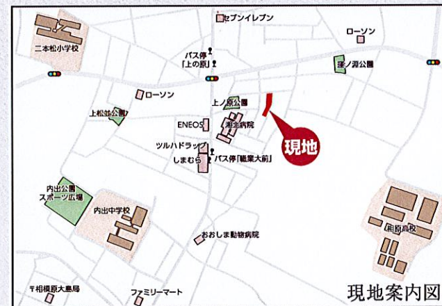
カーナビ 相模原市緑区二本松1丁目32付近

【フラット35】S 金利Bプラン利用可 優良住宅取得支援制度 【別途費用】 フラット35 適合証明取得費用(利用の場合) 外構、火災保険、住宅ローンに伴う費用