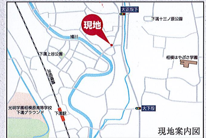
カーナビ 相模原市南区下溝1689付近