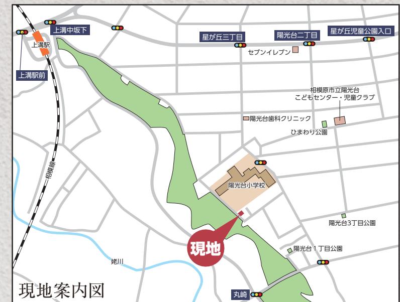
カーナビ 相模原市中央区陽光台1-16-24付近

【フラット35】S 金利B プラン利用可 優良住宅取得支援制度 【別途費用】 フラット 35 適合証明取得費用 (利用の場合) 外構、火災保険、住宅ローンに伴う費用