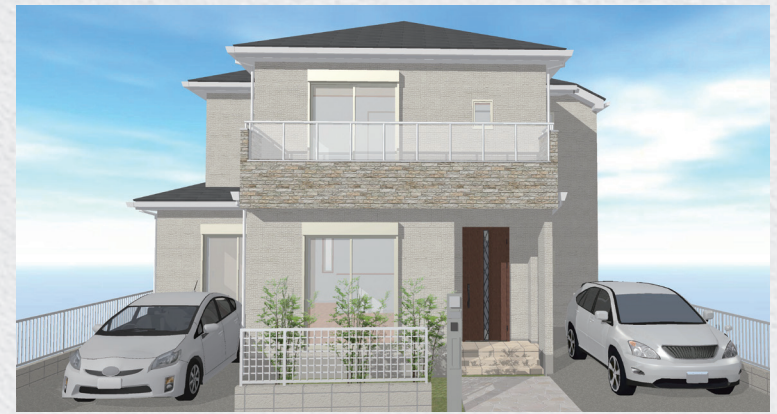
※イメージパースにつき実際とは異なる場合がございます。