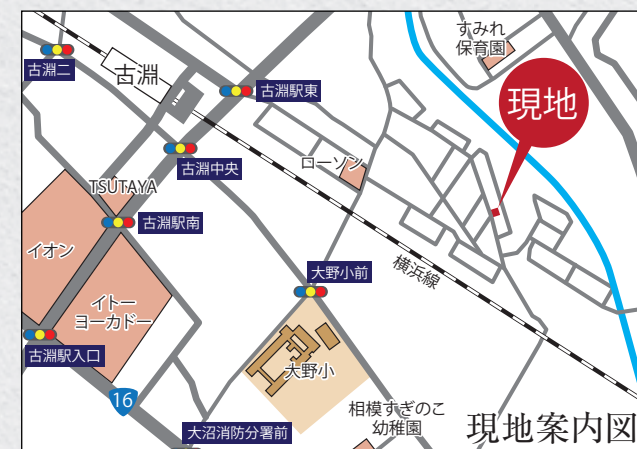
カーナビ 相模原市南区古淵4丁目16-15付近