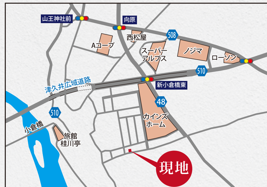
現地案内図 カーナビ 相模原市緑区向原3丁目21-9 と入力