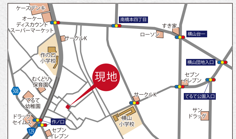
現地案内図 カーナビ 相模原市緑区下九沢319付近